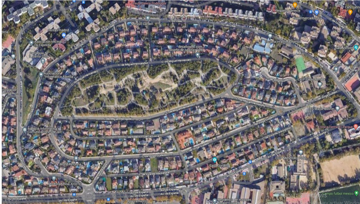
Barrio de Las Conejeras, Coslada